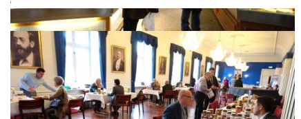
3. Rencontres avec les opérateurs locaux