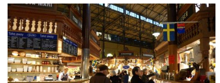
2. Visites de points de vente