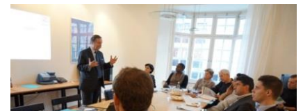
1. Présentations de marché